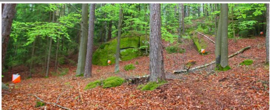
Kartenbeispiel und Postengruppe eines Wettkampfes im Trail-O. Welcher der Posten im Gelände entspricht dem auf der Karte?